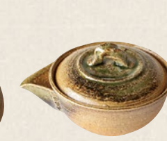
K-212 伊賀泡瓶 (70cc) 3,500円(税抜)