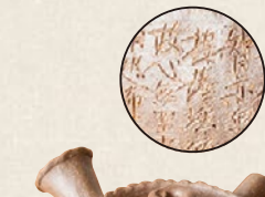
K-216 般若心経彫 (180cc) 15,000円(税抜)