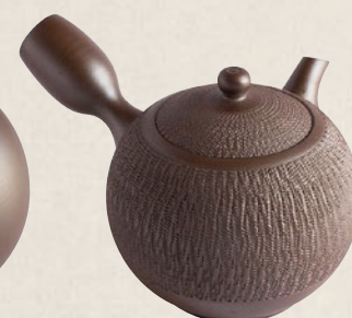
K-018 丸ビリ (320cc) 6,000円(税抜)