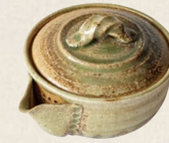
K-213 伊賀泡瓶 (210cc) 4,000円(税抜)