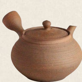
K-008 南蜜ダルマ無地 (200cc) 7,000円(税抜)