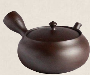
K-001 紫泥平形小 (200cc) 7,000円(税抜)