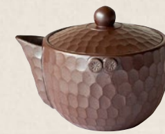
K-208 ダイヤ泡瓶 (170cc) 13,000円(税抜)