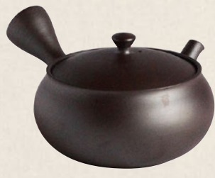
K-002 紫平形大 (240cc) 7,000円(税抜)