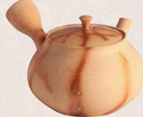
K-011 火燗ダルマ型 (210cc) 7,000円(税抜)