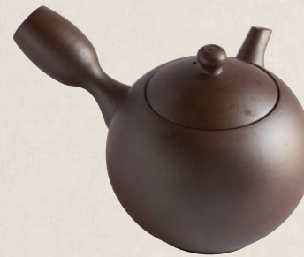
K-017 丸無地 (320cc) 6,000円(税抜)