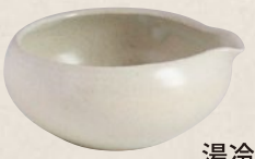
K-030 湯冷まし白丸 (160cc) 2,000円(税抜)