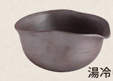
K-028 湯冷し紫泥瓢 (130cc) 2,000円(税抜)