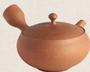
K-010 南蜜平形 (220cc) 7,000円(税抜)