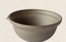
K-223 湯サマシ (80cc) 2,500円(税抜)