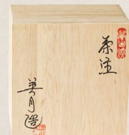
K-214 丸型インロー無地 (140cc) 22,000円(税抜)