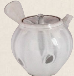
K-006 白釉流し駒型 (200cc) 7,000円(税抜)