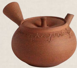
K-009 南蜜ダルマ釘彫 (200cc) 7,000円(税抜)