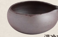
K-029 湯冷まし丸型浅 (160cc) 2,000円(税抜)