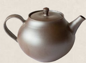
K-202 紫泥後ろ手 (120cc) 10,000円(税抜)