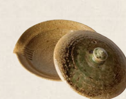
K-211 伊賀絞り出し (20cc) 3,000円(税抜)