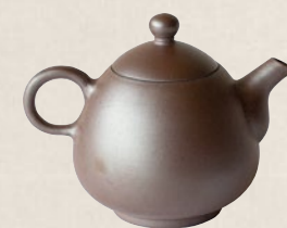
K-206 紫泥後ろ手 (140cc) 8,000円(税抜)