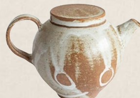
K-203 灰釉後ろ手 (150cc) 10,000円(税抜)