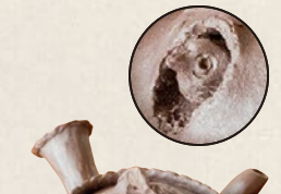
K-215 雀のお宿飛出し (160cc) 15,000円(税抜)