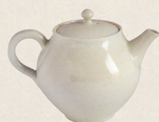
K-013 白後ろ手 (220cc) 8,000円(税抜)