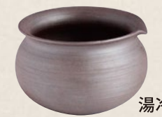
K-027 湯冷し紫泥丸 (190cc) 2,000円(税抜)