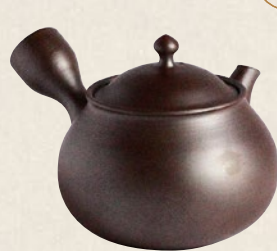
K-003 紫型ダルマ型 (200cc) 7,000円(税抜)