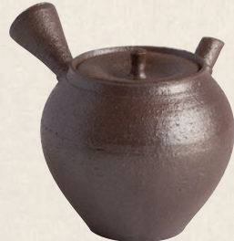
K-007 窯変木米型 (200cc) 7,000円(税抜)