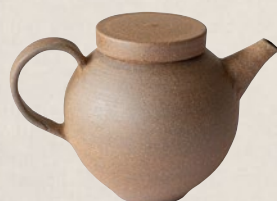
K-201 南蜜後ろ手 (150cc) 10,000円(税抜)