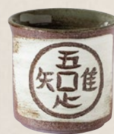
K-218 吾唯足知 (150cc) 2,200円(税抜)