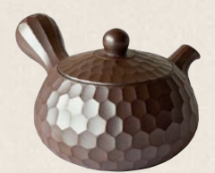
K-210 1号ダイヤカット栗型 (140cc) 11,000円(税抜)