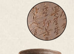
K-217 般若心経彫湯呑 (160cc) 5,000円(税抜)