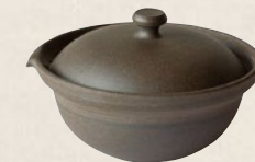
K-222 絞り出し (80cc) 4,600円(税抜)