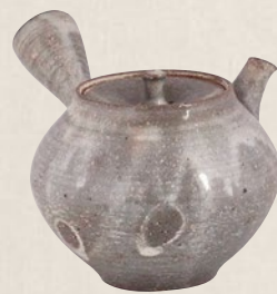
K-005 灰釉駒型 (200cc) 7,000円(税抜)