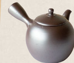
K-219 無病・六瓢 (150cc) 2,200円(税抜)