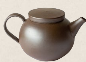
K-204 紫泥後ろ手 (140cc) 10,000円(税抜)