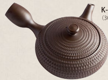
K-016 平形線ビリ (300cc) 8,000円(税抜)