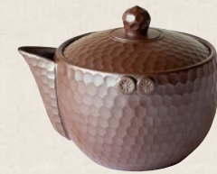
K-209 極ダイヤ泡瓶 (170cc) 18,000円(税抜)