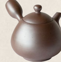
K-207 紫泥横手 (140cc) 8,000円(税抜)