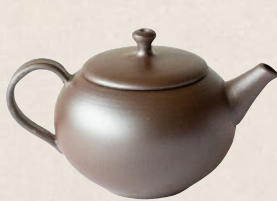
K-205 紫泥後ろ手 (120cc) 10,000円(税抜)