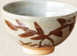
K-260 〈美濃焼抹茶碗〉 唐津茶碗 (12cm×7cm) 1,900円(税抜)