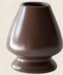
K-084 〈くせ直し〉茶 (高さ7.3cm) 800円(税抜)