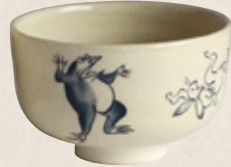
K-052 〈萬古焼抹茶碗〉 鳥獣小茶碗 (10cm×6cm) 1,700円(税抜)