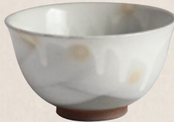
K-056 〈萬古焼抹茶碗〉 掛け分け碗型 (13cm×7.5cm) 1,500円(税抜)