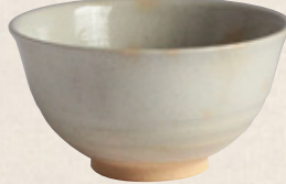
K-053 〈萬古焼抹茶碗〉 粉引碗型 (13cm×7.5cm) 1,500円(税抜)