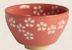
K-066 〈美濃焼抹茶碗〉 赤小茶碗 (10.5cm×6.5cm) 1,500円(税抜)