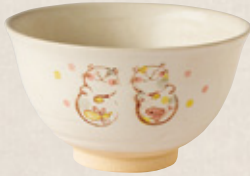
K-259 〈萬古焼抹茶碗〉 猫絵茶碗 (13cm×7.5cm) 2,200円(税抜)