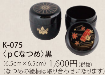
K-075 〈pCなつめ〉黒 (6.5cm×6.5cm) 1,600円(税抜) (なつめの絵柄は取り合わせになります)