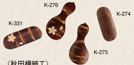
〈秋田樺細工〉 K-274 平形茶箕 (7.6cm×3.2cm) …… 550円(税抜) K-275 瓢茶箕 (8.6cm×3.9cm) …… 900円(税抜) K-276 瓢さくら茶箕 (8.6cm×3.9cm) …… 900円(税抜) K-331 茶箕桜平形 (7.6cm×3.2cm) …… 700円(税抜)