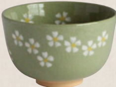
K-061 〈美濃焼抹茶碗〉 ヒワ花絵丸茶碗 (11.5cm×7.5cm) 1,600円(税抜)