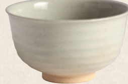
K-054 〈萬古焼抹茶碗〉 粉引段目型 (12cm×7.5cm) 1,500円(税抜)