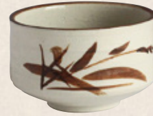
K-059 〈美濃焼抹茶碗〉 白志野茶碗 (12.5cm×7.5cm) 1,600円(税抜)