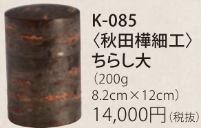
K-085 〈秋田樺細工〉 ちらし大 (200g) 8.2cm×12cm) 14,000円(税抜)