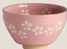
K-069 〈美濃焼抹茶碗〉 ピンク小茶碗 (10.5cm×6.5cm) 1,500円(税抜)