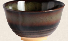
K-055 〈萬古焼抹茶碗〉 天目碗型 (13cm×7.5cm) 1,500円(税抜)