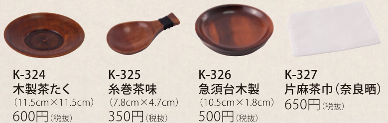
K-324 木製茶たく (11.5cm×11.5cm) 600円(税抜) K-325 糸巻茶味 (7.8cm×4.7cm) 350円(税抜) K-326 急須台木製 (10.5cm×1.8cm) 500円(税抜) K-327 片麻茶巾(奈良晒) 650円(税抜)