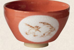
K-264 〈美濃焼抹茶碗〉 鳥獣赤小茶碗 (10.5cm×6.5cm) 1,700円(税抜)