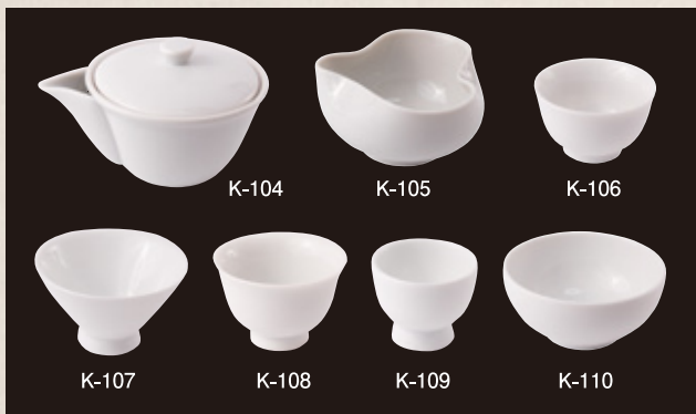
K-104 〈美濃焼〉白磁泡瓶 (150cc 9.5cm×7cm) 3,000円(税抜) K-105 〈美濃焼〉白磁さまし (100cc 9.5cm×7cm) 1,400円(税抜) K-106 〈美濃焼〉白磁腰丸碗 (80cc 7.1cm×4.5cm) 500円(税抜) K-107 〈美濃焼〉白磁朝顔碗 (80cc 8.3cm×4.7cm) 580円(税抜) K-108 〈美濃焼〉白磁玉露碗 (50cc 6.1cm×4.3cm) 520円(税抜) K-109 〈美濃焼〉白磁聞香杯 (50cc 5cm×4.2cm) 540円(税抜) K-110 〈美濃焼〉拝見碗 (180cc 9.5cm×4.7cm) 1,100円(税抜)