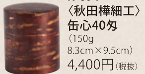
K-091 〈秋田樺細工〉 缶心40匁 (150g) 8.3cm×9.5cm) 4,400円(税抜)