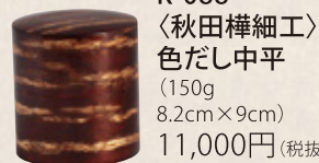
K-088 〈秋田樺細工〉 色だし中平 (150g) 8.2cm×9cm) 11,000円(税抜)