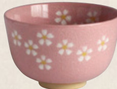
K-064 〈美濃焼抹茶碗〉 ピンク花絵丸茶碗 (11.5cm×7.5cm) 1,600円(税抜)