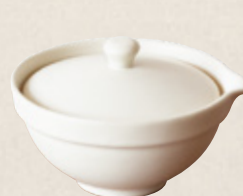
K-265 〈萬古焼〉 白釉葉絞り出し (80cc 11cm×7cm) 1,900円(税抜)