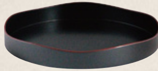
K-079 〈山道盆〉 (27cm×3.5cm) 3,500円(税抜)