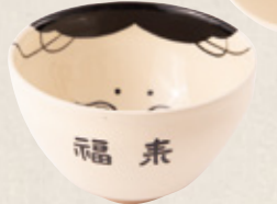
K-329 〈美濃焼抹茶碗〉 お多福小茶碗 (10.5cm×6.5cm) 1,700円(税抜)