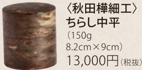
K-086 〈秋田樺細工〉 ちらし中平 (150g) 8.2cm×9cm) 13,000円(税抜)