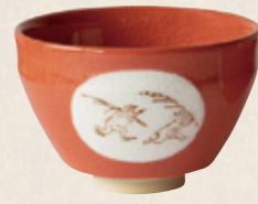
K-263 〈美濃焼抹茶碗〉 鳥獣赤茶碗 (11.5cm×7.5cm) 1,900円(税抜)