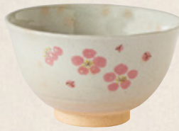
K-262 〈萬古焼抹茶碗〉 梅絵茶碗 (12cm×7.5cm) 1,900円(税抜)