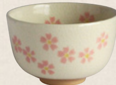
K-065 〈美濃焼抹茶碗〉 白花絵丸茶碗 (11.5cm×7.5cm) 1,600円(税抜)