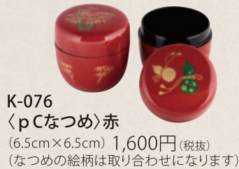
K-076 〈pCなつめ〉赤 (6.5cm×6.5cm) 1,600円(税抜) (なつめの絵柄は取り合わせになります)