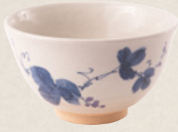
K-328 〈萬古焼抹茶碗〉 蔦茶碗 (13cm×7.5cm) 2,400円(税抜)