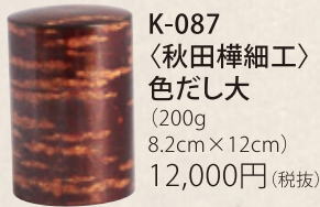
K-087 〈秋田樺細工〉 色だし大 (200g) 8.2cm×12cm) 12,000円(税抜)