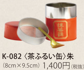
K-082 〈茶ふるい缶〉朱 (8cm×9.5cm) 1,400円(税抜)