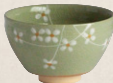
K-070 〈美濃焼抹茶碗〉 ヒワ小茶碗 (10.5cm×6.5cm) 1,500円(税抜)