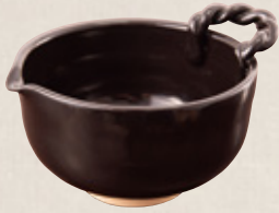
K-323 〈萬古焼抹茶碗〉 手付茶碗天目 (15cm×12cm×8cm) 2,400円(税抜)