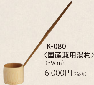
K-080 〈国産兼用湯杓〉 (39cm) 6,000円(税抜)

現代のように冷蔵保管ができなかった時代、外の気温・湿度・匂いからお茶の品質を保つために桜皮を使った茶筒が愛用されてきました。