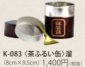
K-083 〈茶ふるい缶〉溜 (8cm×9.5cm) 1,400円(税抜)