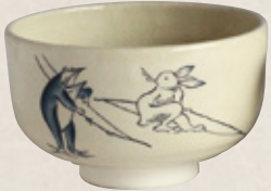
K-051 〈萬古焼抹茶碗〉 鳥獣筒型 (12cm×7.5cm) 2,200円(税抜)