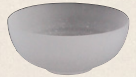
K-060 〈廣田硝子〉 ガラス茶碗 (11.5cm×5.5cm) 2,200円(税抜)