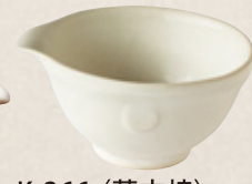
K-266 〈萬古焼〉 白釉葉さまし (100cc 9.5cm×5cm) 1,000円(税抜)