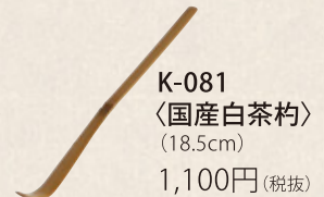
K-081 〈国産白茶杓〉 (18.5cm) 1,100円(税抜)