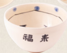
K-330 〈美濃焼抹茶碗〉 ひよっこ小茶碗 (10.5cm×6.5cm) 1,700円(税抜)