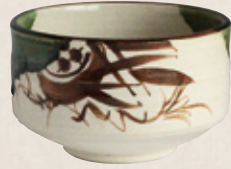
K-057 〈美濃焼抹茶碗〉 織部茶碗 (12.5cm×7.5cm) 1,600円(税抜)