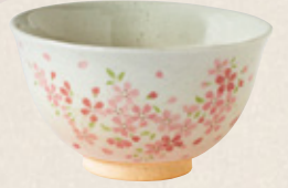
K-258 〈萬古焼抹茶碗〉 桜づくし茶碗 (13cm×7.5cm) 2,400円(税抜)