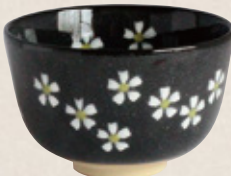
K-062 〈美濃焼抹茶碗〉 黒花絵丸茶碗 (11.5cm×7.5cm) 1,600円(税抜)