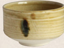
K-058 〈美濃焼抹茶碗〉 黄瀬戸茶碗 (12.5cm×7.5cm) 1,600円(税抜)