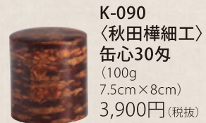
K-090 〈秋田樺細工〉 缶心30匁 (100g) 7.5cm×8cm) 3,900円(税抜)