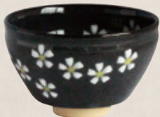
K-067 〈美濃焼抹茶碗〉 黒小茶碗 (10.5cm×6.5cm) 1,500円(税抜)