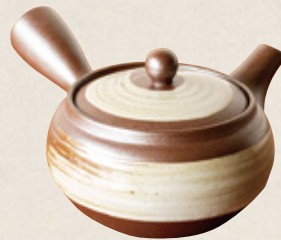
K-245 平丸白はげ目 (底網) (400cc) 2,500円(税抜)