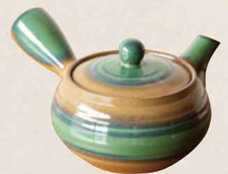
K-236 平形銅 (底網) (300cc) 2,300円(税抜)