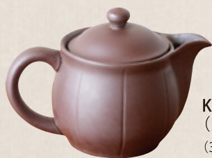
K-256 ポット紫泥 (かご網) (380cc) 2,200円(税抜)