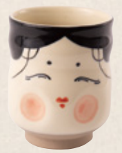
K-332 お多福寿司湯呑 (8.7cm×10.2cm) 1,600円(税抜)