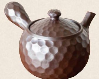
K-255 ダイヤ3号紫泥 (丸網) (620cc) 3,700円(税抜)