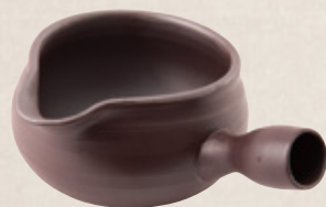
K-321 段目手つき冷まし (250cc) 2,200円(税抜)