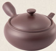
K-311 平丸 (サークル網) (220cc) 2,700円(税抜)