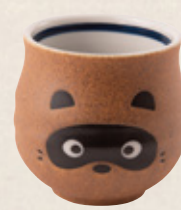
K-337 狸湯呑 (7.1cm×7.6cm) 1,100円(税抜)