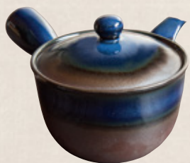
K-317 碗型青 (底網) (350cc) 2,700円(税抜)