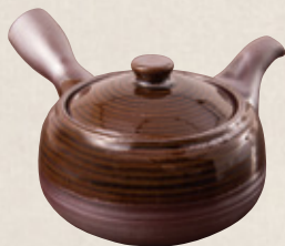
K-313 福型飴釉 (サークル網) (260cc) 2,100円(税抜)