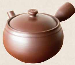
K-253 左手カメ型紫泥 (サークル網) (350cc) 2,700円(税抜)