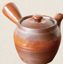
K-235 ツボ型赤 (丸網) (350cc) 2,300円(税抜)