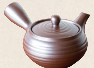
K-251 平型紫泥 (底網) (300cc) 2,300円(税抜)