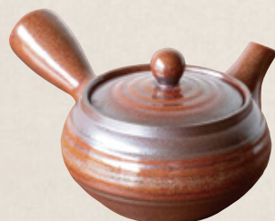
K-233 平型赤 (底網) (300cc) 2,300円(税抜)