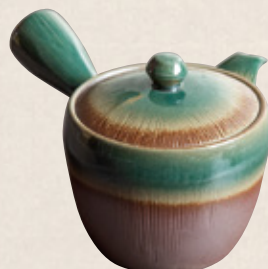
K-318 千筋織部 (丸網) (370cc) 2,400円(税抜)