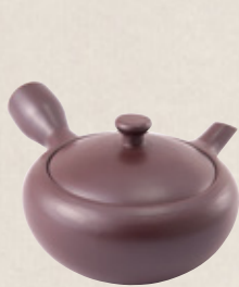
K-309 鉄鉢 (サークル網) (150cc) 2,600円(税抜)