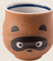
K-336 狸寿司湯呑 (9cm×8.5cm) 1,300円(税抜)