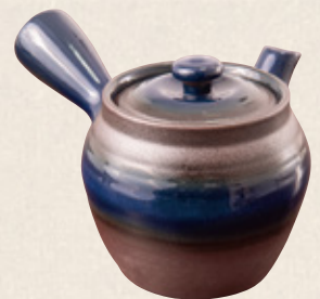
K-316 ツボ型青 (平網) (350cc) 2,300円(税抜)