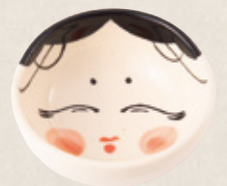
K-335 お多福盃 (8.8cm×11cm) 800円(税抜)