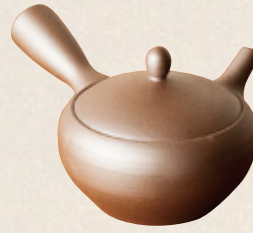
K-250 鉄鉢紫泥 (底網) (260cc) 7,500円(税抜)