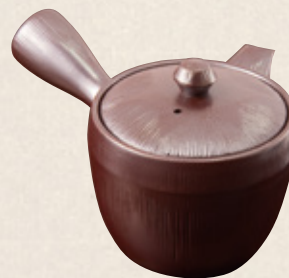
K-319 千筋銀彩 (丸網) (370cc) 2,400円(税抜)