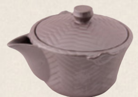
K-312 アジロ泡品 (平網) (200cc) 1,800円(税抜)