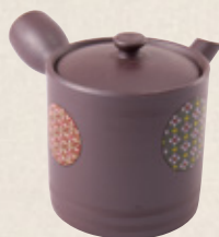
K-314 切立友禅 (平網) (150cc) 2,500円(税抜)