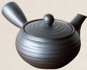
K-248 平型黒 (底網) (330cc) 2,300円(税抜)