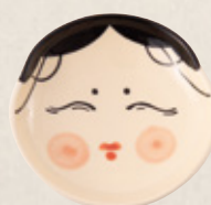
K-333 お多福小皿 (8.5cm×2cm) 800円(税抜)