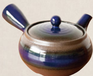
K-231 平丸型青 (底網) (400cc) 2,500円(税抜)