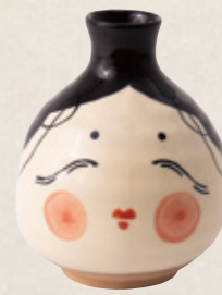
K-334 お多福一輪(徳利) (310cc 6.2cm×2.7cm) 2,000円(税抜)