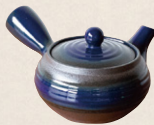
K-224 平型青 (底網) (300cc) 2,300円(税抜)