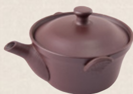
K-322 泡品 (平網) (150cc) 2,700円(税抜)