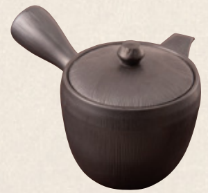
K-320 千筋ようがん (丸網) (370cc) 2,400円(税抜)