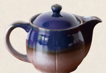
K-228 ポット青 (かご網) (380cc) 2,200円(税抜)