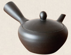
K-246 鉄鉢型黒 (底網) (260cc) 7,500円(税抜)