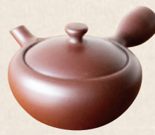
K-254 左手鉄鉢型紫泥 (サークル網) (150cc) 2,600円(税抜)