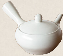
K-243 鉄鉢型白 (底網) (260cc) 7,500円(税抜)