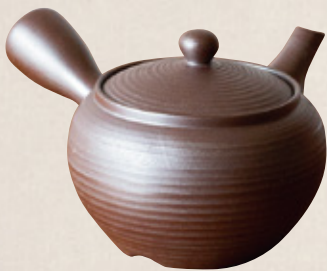
K-252 丸型大 (底網) (700cc) 4,600円(税抜)