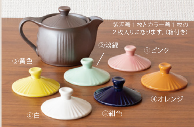
K-257 変え蓋ポット 6色の変え蓋 (平網) (400cc) 2,900円(税抜)