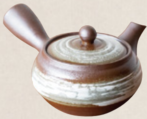
K-242 平型白はげ目 (底網) (300cc) 2,300円(税抜)

・・・ ステンレス茶こし網は、網の細かさ、形状などに特徴があり、使いやすや、お茶を美味しく入れる工夫が施されています。