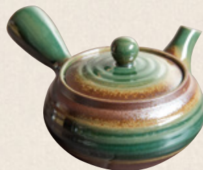
K-315 平丸織部 (底網) (300cc) 2,300円(税抜)