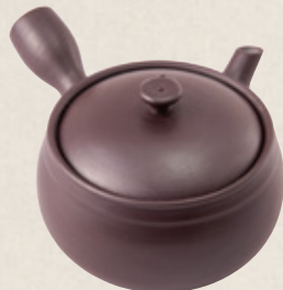
K-310 カメ型 (サークル網) (350cc) 2,700円(税抜)